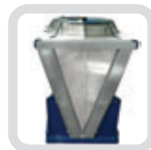
Gabinete en "V"